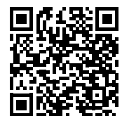
Pagina LinkedIn di Conus Srl

In alto, la configurazione d'impianto installata in un'aula di grandi dimensioni, da 190/177 posti predisposta per didattica mista, in presenza e da remoto. Sopra, l'uniformità sonora della diffusione audio a 2k Hz 3 db/ottava.